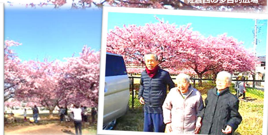
佐倉西の多目的広場