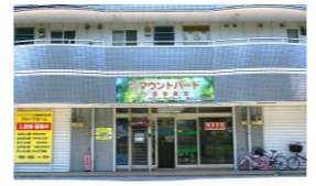
株式会社マウントバード 千葉介護事業部