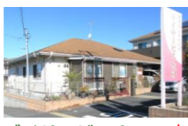
デイサービス大日 空1